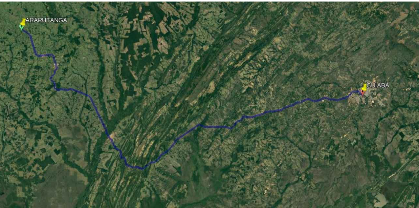
DMT - MATERIAL ASFÁLTICO - 330 KM SEM ESCALA