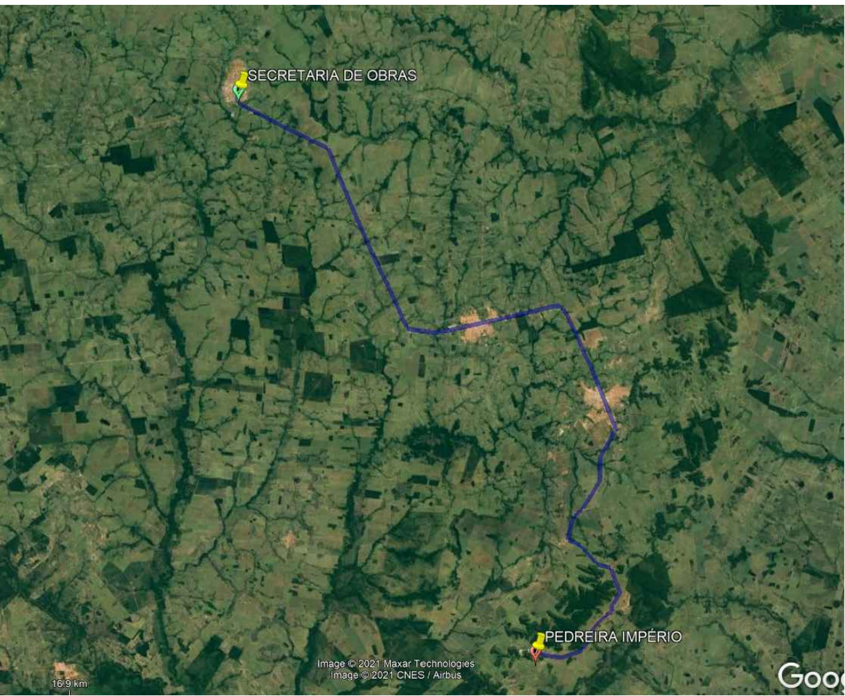
DMT - MATERIAL BRITADO - 62 KM SEM ESCALA